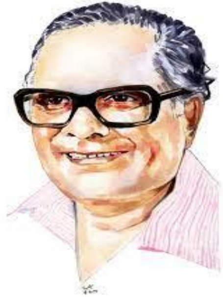
రావి శాస్త్రి జయంతి జూలై 30