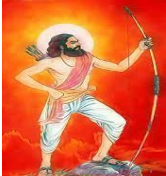
అల్లాల సీతారామరాజు జయంతి జూలై 4