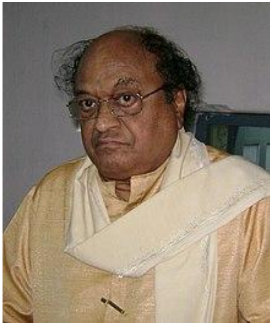
మహాకవి సినారె జయంతి జూలై 29