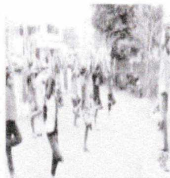
వేసవిశిక్షణ శిబిరంలో యోగాసనాలు సాధన చేస్తున్న విద్యార్థులు